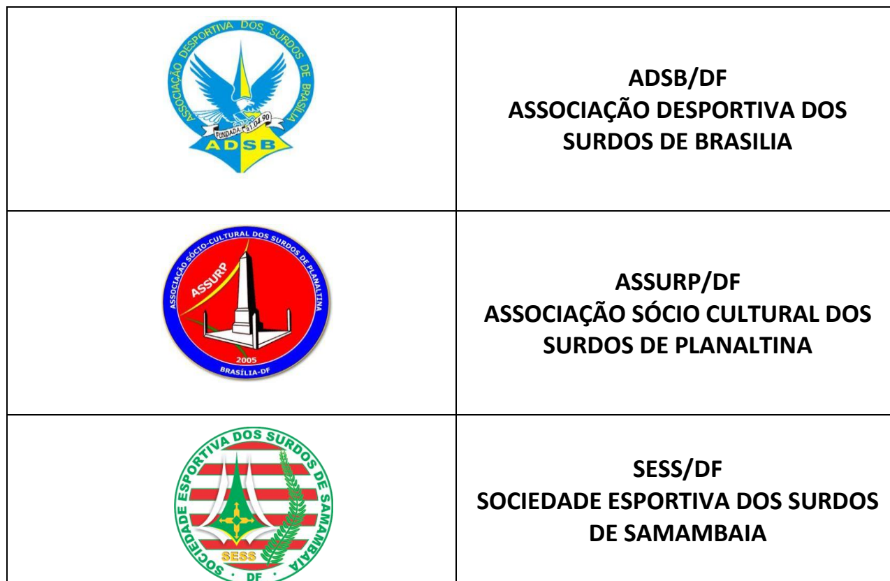
TABELA E JOGOS