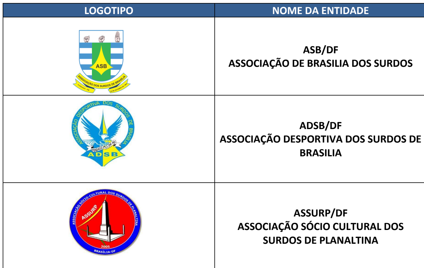
TABELA E JOGOS