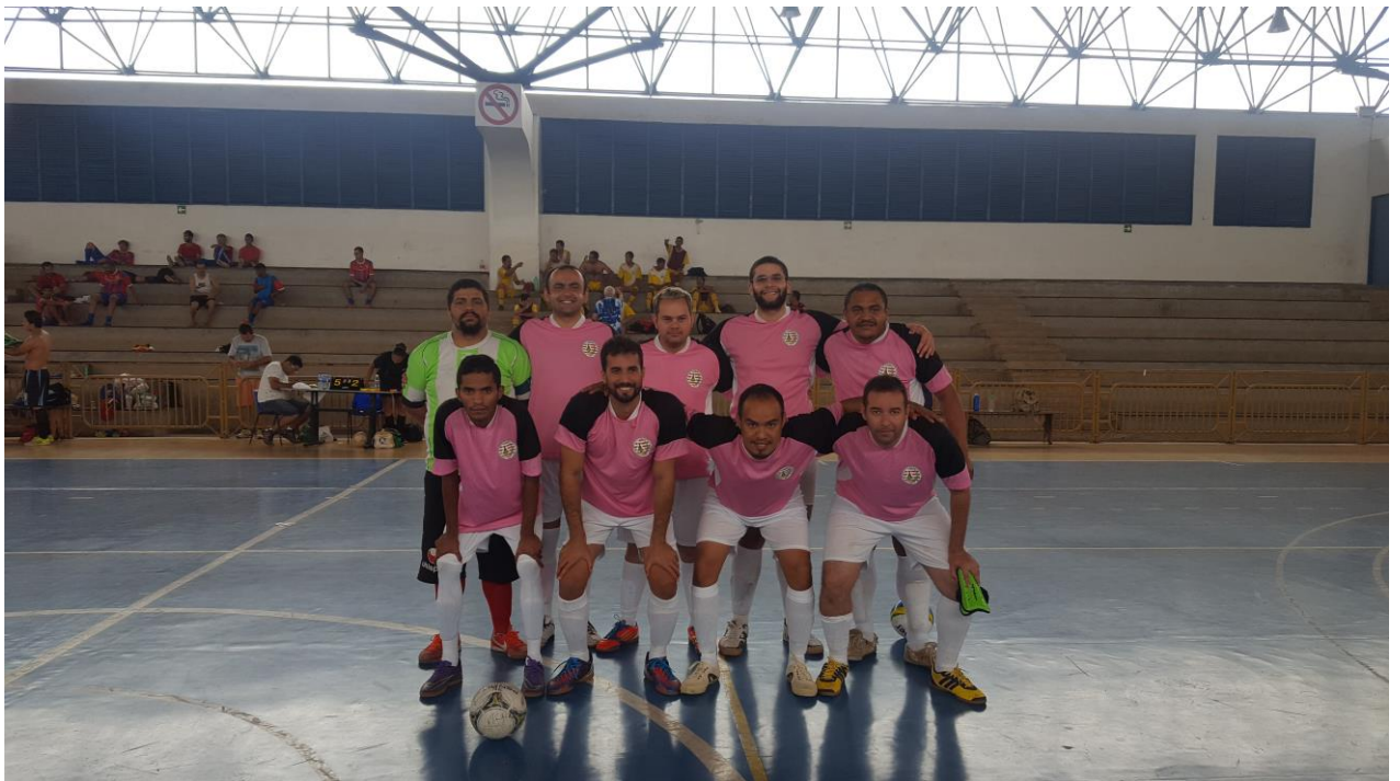
Sociedade Esportiva dos Surdos de Samambaia – SESS