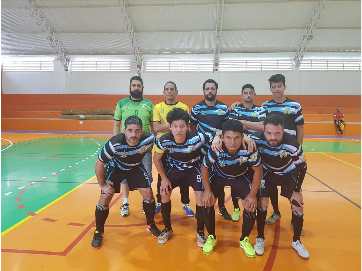
Associação dos Surdos de Brasília – ASB