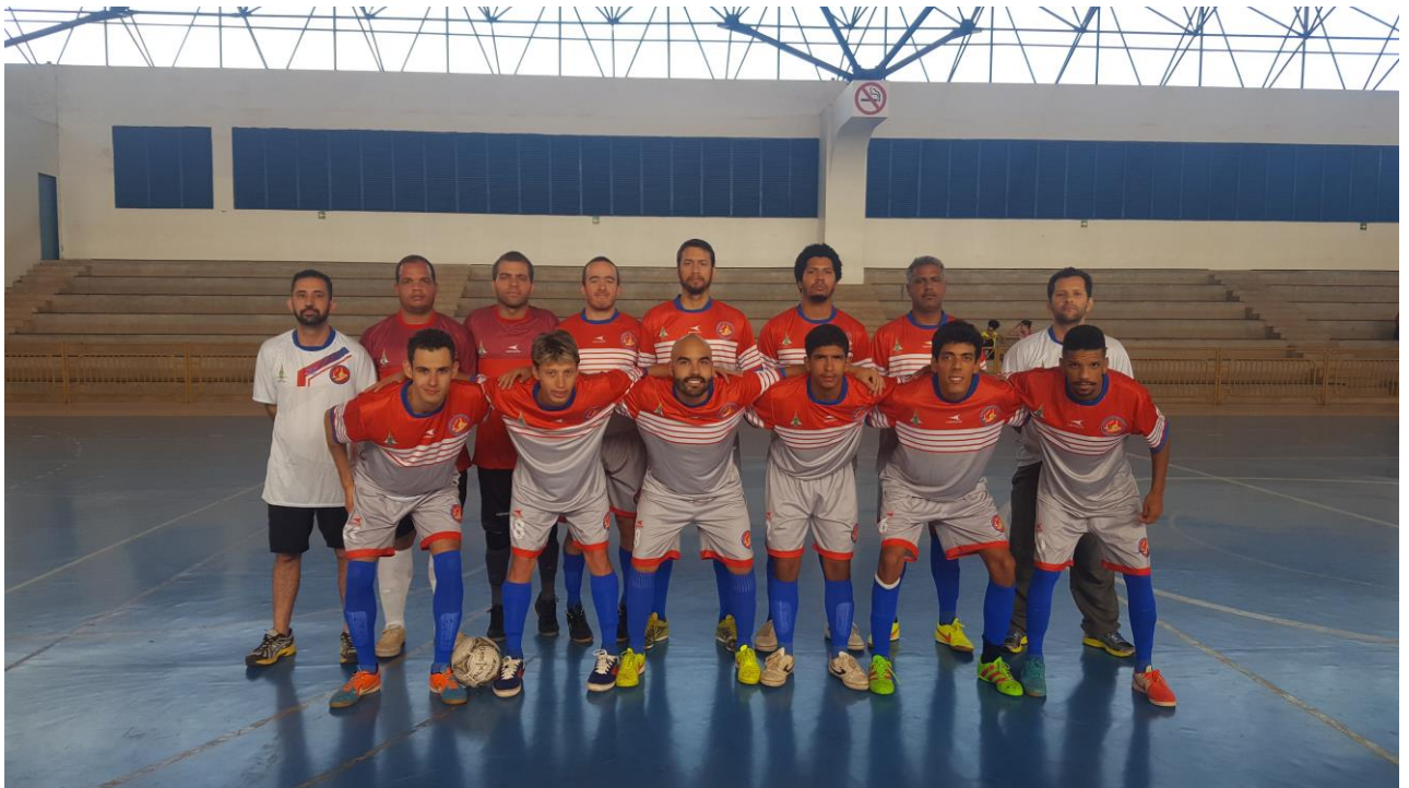
Associação Sócio Cultural dos Surdos de Planaltina – ASSURP