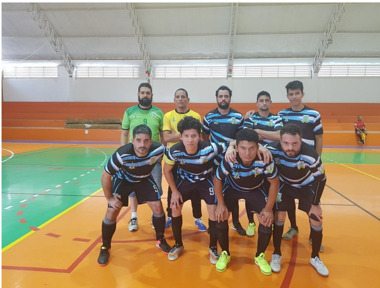
Associação dos Surdos de Brasília – ASB