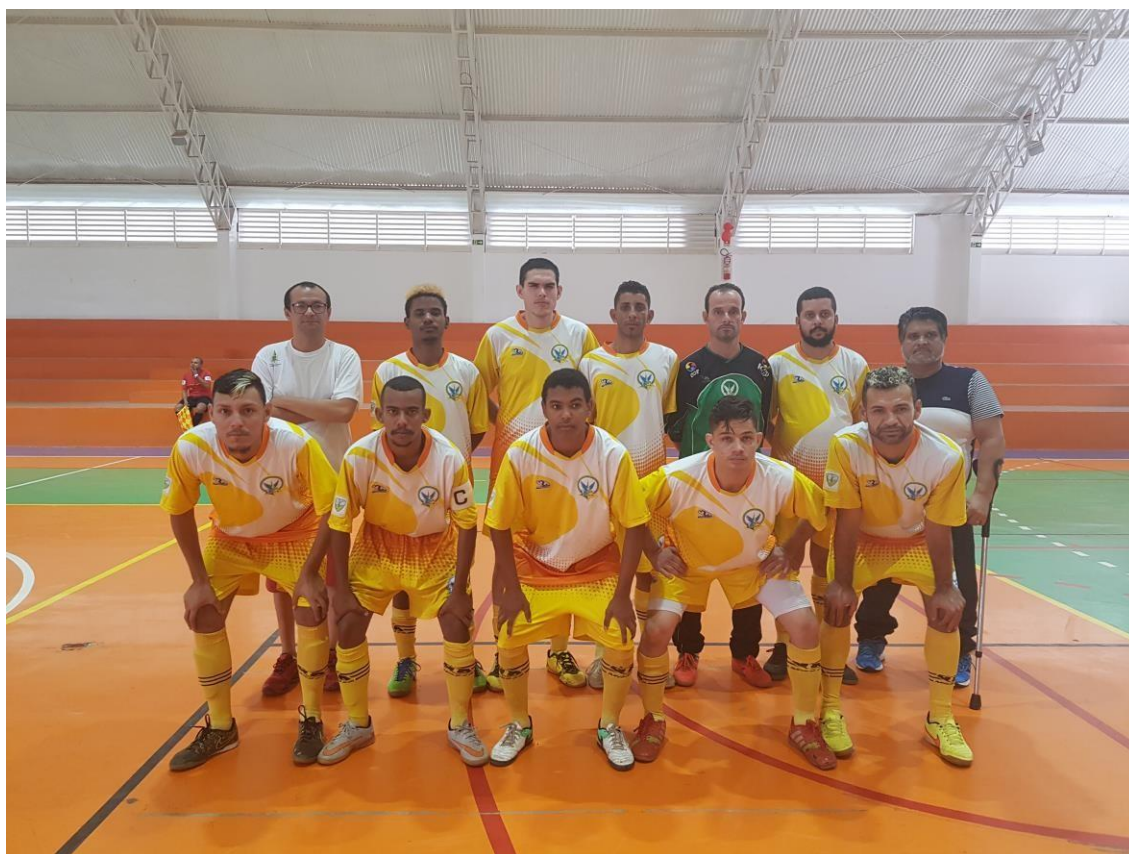
Associação Desportiva dos Surdos de Brasília – ADSB