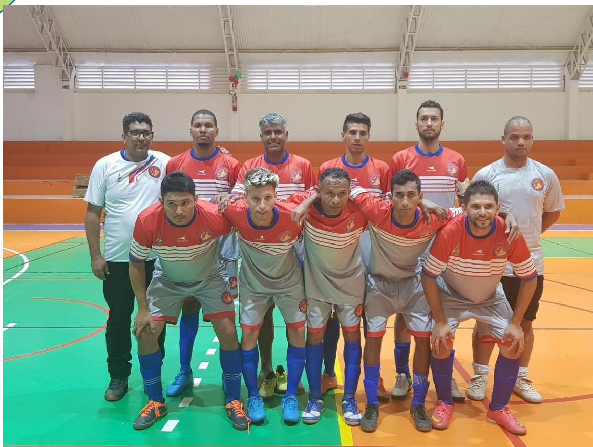
Associação Sócio Cultural dos Surdos de Planaltina – ASSURP