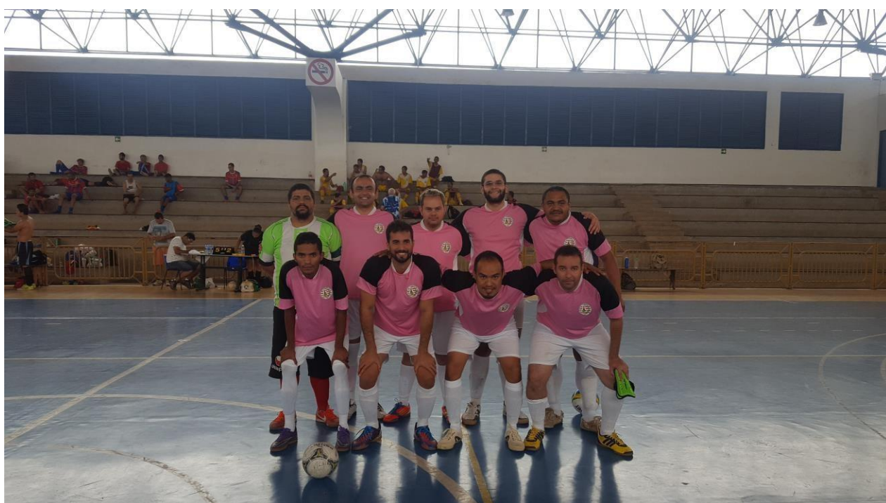
Sociedade Esportiva dos Surdos de Samambaia – SESS