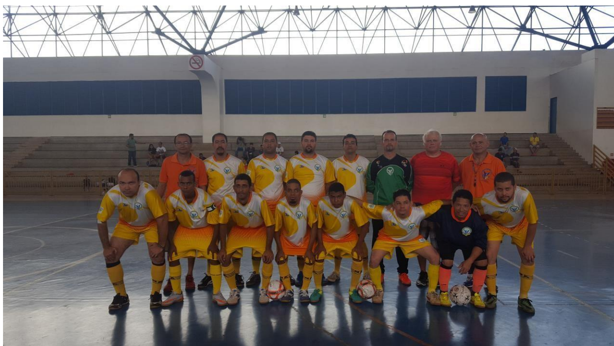
Associação Desportiva dos Surdos de Brasília – ADSB