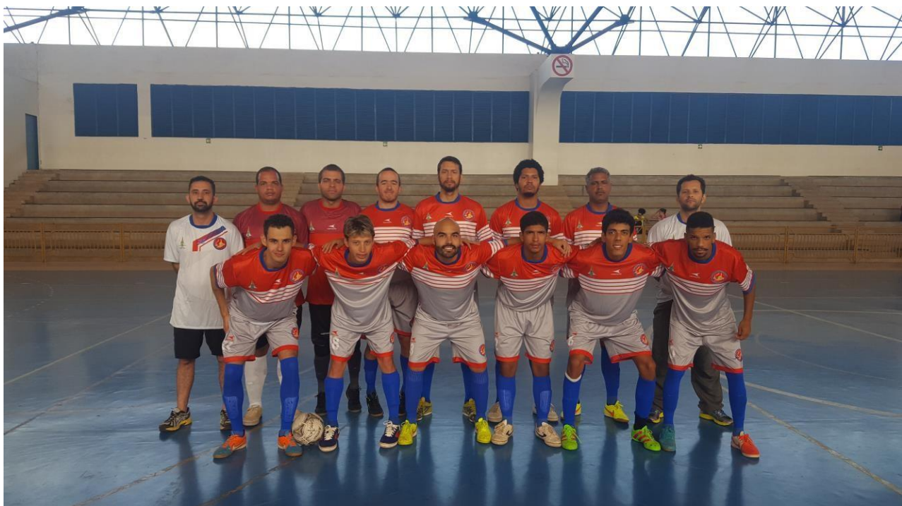
Associação Sócio Cultural dos Surdos de Planaltina – ASSURP