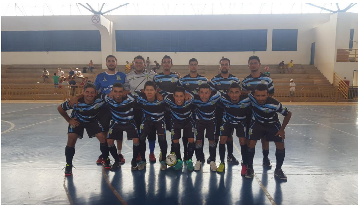
Associação dos Surdos de Brasília – ASB