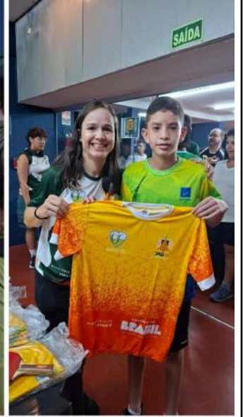
1ª ETAPA DO CIRCUITO CANDANGO DE TENIS DE MESA 1º DE MARÇO DE 2026