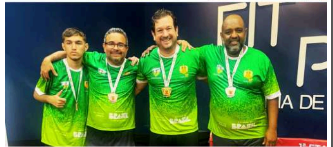
1ª ETAPA DO CIRCUITO CANDANGO DE TÊNIS DE MESA JASDF FEDERAÇÃO BRASILENSE DESPORTIVA DOS SURDOS MINISTÉRIO DO ESPORTE GOVERNO DO BRASIL