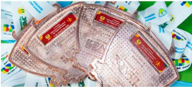
1ª ETAPA DO CIRCUITO CANDANGO DE TÊNIS DE MESA JASDF FEDERAÇÃO BRASILENSE DESPORTIVA DOS SURDOS MINISTÉRIO DO ESPORTE GOVERNO DO BRASIL